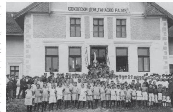
16. Чланови Соколског друштва “Танаско Рајић” испред свог Дома (Чачак, око 1926)

Основна активност, око које се Друштво у Чачку највише ангажовало били су разни слетови. То је била прилика да се прикаже увежбано, процени физичка припремљеност чланова, промовише локално Друштво и његов рад, али и упознају нови крајеви и јавно шири соколска идеја.