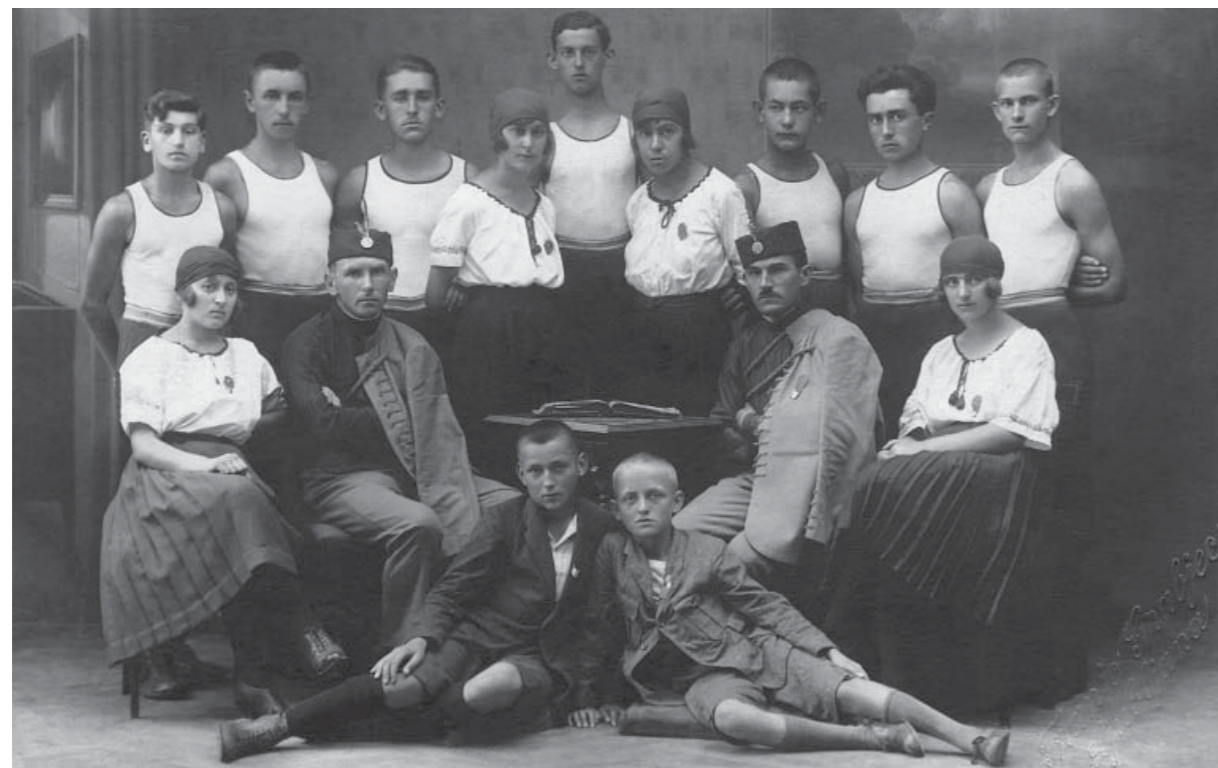
23. Соколи из Чачка, учесници слета у Љубљани (12. август 1922)

и саставни део заборављеног идентитета једног града.