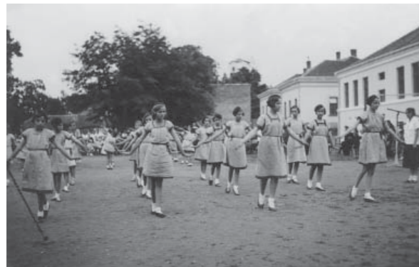
12. Група девојчица из нараштаја Соколског друштва вежба испред Соколане (Чачак, после 1930)

Иако је основни циљ соколства физичка и духовна припрема чланова, културна и забавна компонента целе организације била је веома развијена. Временом, соколске играчке у Чачку постале су значајније место где се окупљала средњошколска омладина. Концерти су организовани обично за велике празнике, као што су Нова година, Божић, Ускрс. Организовању ове активности посвећивана је, можда, највећа пажња после припрема за слетове. Често је долазило до