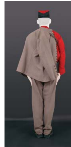
101. соколска униформа

Овом одлуком и Срби у Краљевини Србији директно се укључују у соколски покрет, мада још увек вежбају према различитим гимнастичким системима, од којих је шведски постао доминантан. Један део вежбача није прихватио одлуку да се Друштво веже за соколски покрет, подстакнут мишљу да треба створити једну више националну, српску организацију и не поводити се за утицајима који су долазили из Аустро-Угарске. Подела је постојала и у начину вежбања, јер су Соколи уводили Тиршов систем, а они који су му се супротстављали вежбали су и даље према шведском и немачком систему.