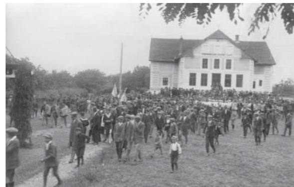
17. Поворка Сокола креће са заставама од Соколане (Чачка, око 1930)

Соколи у Чачку били су покретачи свих спортских дисциплина, али, због свог устројства, временом су постали конзервативна установа која омладини није омогућавала слободу као у другим спортским друштвима. Соколи су у Чачку тридесетих година у летњим месецима уступали своје игралиште и играчима тениса, подржавајући ову игру “која спада у соколски систем”, наглашавајући отменост “белог спорта” у времену општих трка за рекордима и “послератне нервозе” у спортовима који нарушавају хармонију духа и тела.