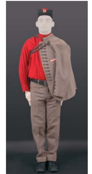
101. соколска униформа

Соколска друштва пре 1910. нису била много раширена у Краљевини Србији, и било их је свега десет. Међутим, током 1910. године дошло је до великог замаха у формирању соколских друштава широм земље. Од фебруара 1910. до фебруара 1911. основано је чак 10 друштава, па и у Чачку, 30. септембра 1910. године (по јулијанском календару).