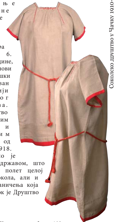
Хаљина за вежбање - 102.

У к и д а њ е парламентарне демократије и диктатура, з а в е д е н а м а н и ф е с т о м краља Александра Карађорђевића 6. јануара 1929. године, успоставили су нови државни и идеолошки поредак, заснован на идеологији интегралног југословенства. Пошто је соколство било на таквим политичким и идеолошким поставкама још од уједињења 1918. године, уследило је повезивање са државом, што је донело нови полет целој организацији Сокола, али и многобројна ограничења која нису постојала док је Друштво било самостално.