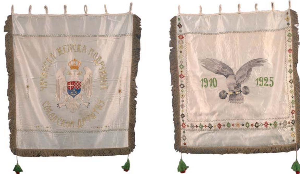
99. Застава Соколског друштва у Чачку