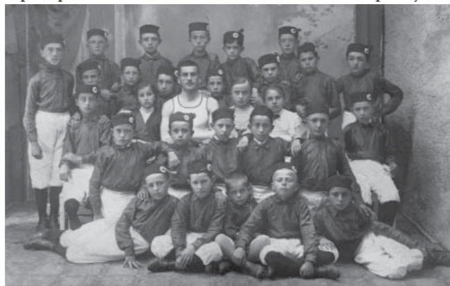
1. Нараштај Соколског друштва у Чачку (1911)

карактера сеоског живота и рада, соколство је настојало да на селу свој рад усмери на културно просвећивање, са задатком здравствено-хигијенског васпитања и економског подизања. Телесно вежбање, као