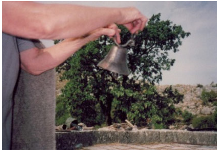
Sl. 4. Zvonce za stoku i gumno, selo Ubalac, Gornji Orahovac. Snimila autorka teksta, avgust, 2003.g.

Kako je Vaskrs pokretan praznik, ali kako uglavnom pada u prolećne dane, vreme bi se često dogodilo da bude lepo i sunčano. Mladež je izlazila iz kuća, obilazili su jedni druge i skupljali se na gumnima ili ispred nečije kuće. Momci su znali da se sastanu i da šarana jaja postave uz zid neke kuće a onda da ih novčićima gađaju. Naravno, ko čije jaje pogodi - dobije ga.