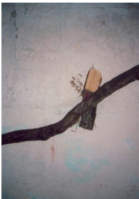
Sl. 3. Badnjak zakačen za čokot vinove loze kraj ulaznih vrata kuće Obrada Dabižinovića. Snimila autorka teksta, avgust, 2003.g.

Na džak sa slamom u kući se postave naćve a u njih se naseče mesa od peciva, kaštradne kuvane, kobasica, pršuta, sira. Poznata je izreka koja oslikava bogatstvo božićne trpeze: "Oj Božiću brate, najedoh se na te, i dva dana po te, al nikad ko na te!" Oko hrane se sedi na tzv. štoklice a na njih se stave vrećice od slame. Prvo polaznik kida komad peciva i to glavu ili plečku. Ukoliko bi to znao, polaznik je gledao u plečku peciva kako bi video kako je sudbina naklonjena domaćinstvu nastupajuće godine. Pre doručka svi pale sveće i mirbože se a posle se sa tim svećama obilaze obori i stoka te se, nekad ranije običavalo i sa stokom se mirbožiti. Na doline i njive se odnosi šipak ili narandža sa lovorom ili maslinom koji se u njih zabodu, a sve radi plodnosti. Za vreme objeda mogao je da se koristi escajg- pošada ali su uglavnom jeli i kidali meso rukama. Polaznik kada odlazi na dar dobija par čarapa, peškir ili košulju. Interesantno je da je na Božić polaznik i jedini gost koji dolazi u kuću. Ovakav običaj zabeležio je još i Vuk Stefanović Karadžić prilikom prikupljanja i opisivanja starih narodnih običaja - nema poseta osim položajnika. 7