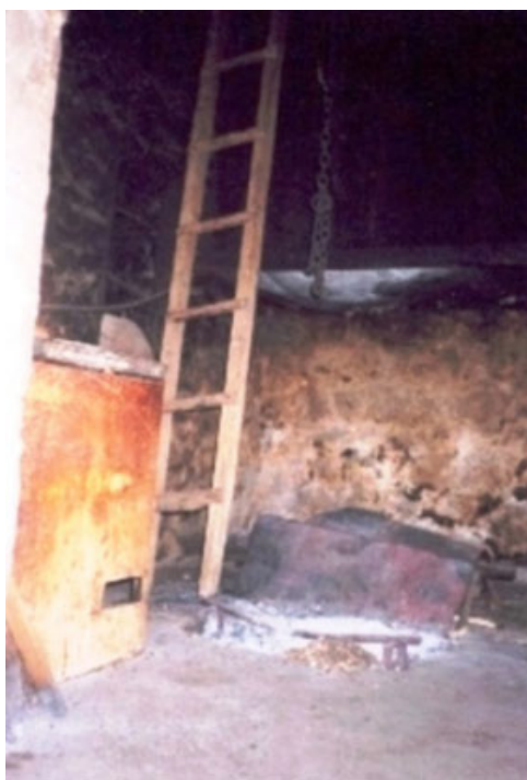
Sl. 2. Staro ognjište u kužini gde je se svojevremeno nalagao badnjak. Kuća Obrada Dabižinovića, selo Ubalac, Gornji Orahovac. Snimila autorka teksta, avgust, 2003.g.

Domaćica donese slamu i pospe je po kužini još preko dana. Po slami se sedi i jede. Žene ne smeju da dodiruju naložene badnjake, ne smeju ni da ih preskoče te su, uglavnom, pogotovo ženska deca, sedela podalje od samog ognjišta. Dok gori badnjak nad ognjištem se peče i pecivo na ražnju. Muškarci su zaklali i uredili pecivo- obavezno koza ili ovan koje nazivaju bravima, i nakon nalaganja badnjaka, ili i pre, postavili ga da se peče na ognjištu za sutrašnju božićnu gozbu.