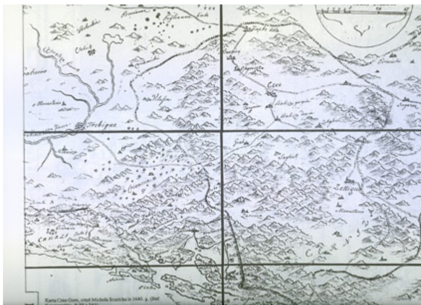
Sl. 1. Karta Crne Gore, crtež Michela Scnricha iz 1640.g. na kojoj je ucrtan i obeležen Gornji Orahovac 4

Teme koje su bile prioritete prilikom našeg istraživanja bile su vezane, kao što je već pomenuto, za pokušaj teoretskog rekonstruisanja nekadašnjeg načina života stanovnika Gornjeg Orahovca. Naime, Gornji Orahovac je sastavljen od 6 zaselaka 5 a 2003. godine je u njima bilo stalno naseljenih dvoje ljudi Ubalacu; pored njih, manji broj trajno odseljenih s vremena na vreme obilazi svoja stara ognjišta i radi na imanjima. Samim tim, jasno je da su iseljenički migracijski tokovi bili brojni tako da jedna od tema bila njima i posvećena. Sledeća u nizu tema, vezana je za osobenosti i bogatstvo materijalne kulture, sa posebnim osvrtom na tradicionalnu arhitekturu sela. Poslednje dve teme, ali ne i po značaju poslednje, posvećene su bile izučavanju obredno-religijskog života sela. Svakako treba znati da se ovaj kulturno-antropološki koncept deli na privatne obrede, vezane za jedinku (npr. kompleks obreda vezanih za porođaj, za smrt, sahrane...) i ciklične, religijske godišnje obrede, uglavnom vezane za grupu - porodica, zadruga, selo... (npr. krsne slave, crkvene i seoske slave, proslave Božića i Vaskrsa...). Tema koju sam ja obrađivala je upravo kompleks godišnjih, cikličnih običaja i religijska praksa porodice.