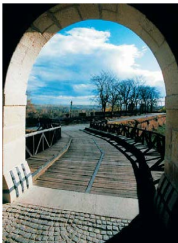
Петроварадинска тврђава - улаз

- Доћи ћемо до најпотпунијег пресека и коначне слике утврђења која ће битно утицати на будуће начине коришћења неких објеката на Тврђави. Ми бисмо у археолошким страстима отишли и дубље, али и ово је сасвим довољно. Већ је у току снимање подземних просторија по савременим стандардима геодезије. Сагледаћемо читав систем тунела чија укупна дужина износи неколико километара и који су прокопани вероватно за случај опсаде, да би војска могла да дође до реке и узме воду. Многе ће лажне и маштовите представе да нестану. Желимо да демистификујемо све што се о тврђави прича јер туризам је једно, а наука је друго.