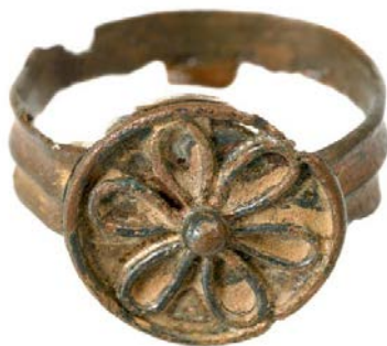
Прстен из XII века - Градац - Народни музеј Крагујевац

Кастел старог, илирског имена Балба, у источној верзији Валва, освојили су Авари 591. године. У осмом веку тврђаву обнавља једно племе прибалтичког порекла – Ободрити и доносе јој ново име - Белич, негде у изворима Беликин, вероватно због високе, беле стене на којој се уздиже и из далека види.