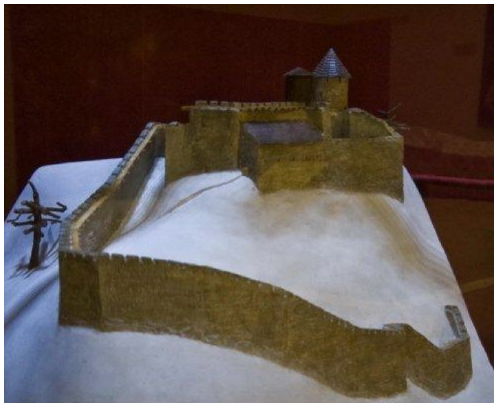
Град на Белој стени - макета - Народни музеј Ваљево