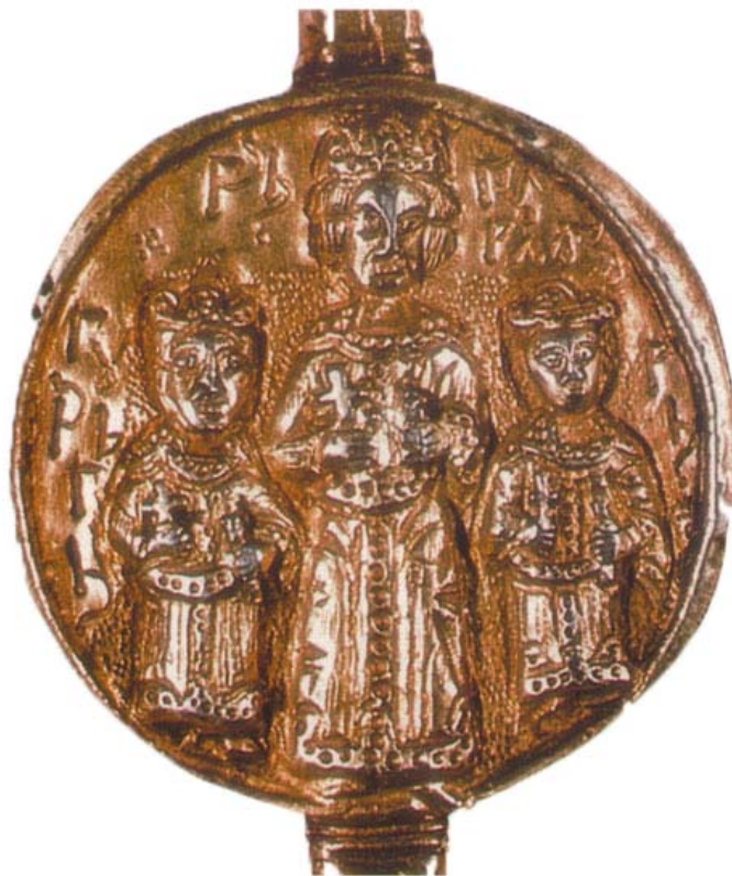
Гргур, Мара и Ђурађ Бранковић на златном печату повеље (Хиландар)