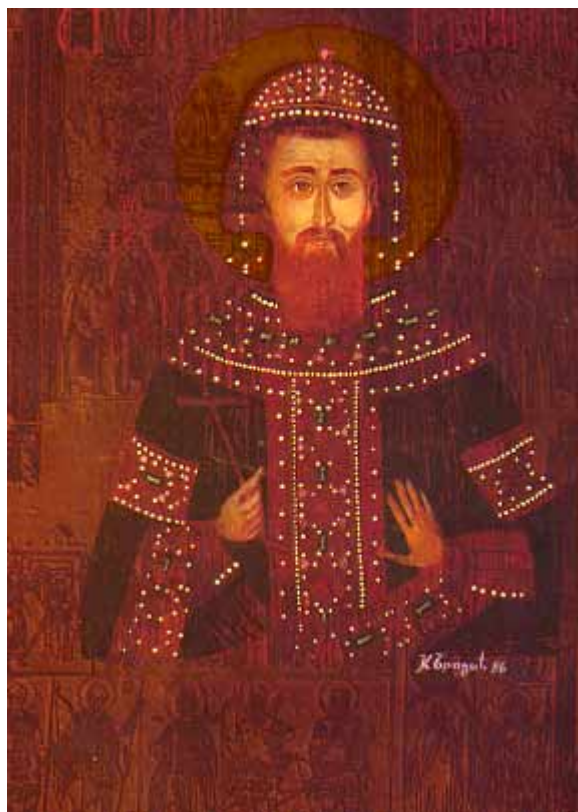
Краљ Стефан Првовенчани - Свети Симон

Прве помене о разрушеној цркви у селу Босута археолози налазе у извештају једног етнолога, члана Српске краљевске академије, који је 1905. године, приликом обиласка ових крајева, забележио приче мештана. Ископавања на локалитету Манастирина, којима је пре две недеље присуствовала екипа Образовно-научног програма Телевизије Београд (Научна редакција), заједно са аутором овог текста, резултат су споразума о изради археолошке мапе Аранђеловца, склопљеног пре шест месеци између Народног музеја У Београду и аранђеловачког музеја.