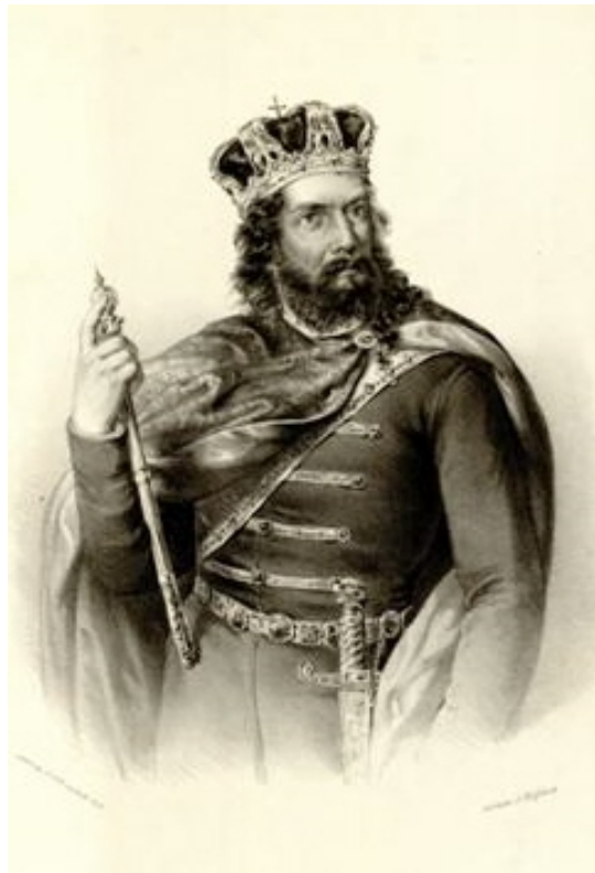
Краљ Стефан Немањић Првовенчани (1196-1227)

Међутим, у овом подрудничком селу (општина Аранђеловац) сачувано је и предање о цркви слепог Гргура, сина Ђурђа Бранковића, предање које у себи можда крије зрно праве истине о ктитору. Археолози аранђеловачког музеја и Народног музеја из Београда верују да ће до краја лета открити ком свецу је црква у Босути посвећена и ко је њен градитељ.