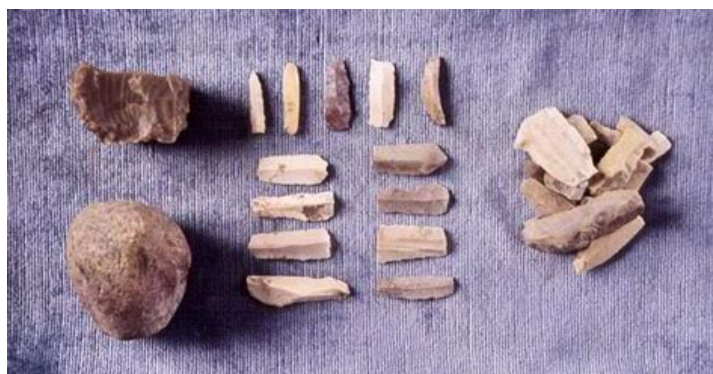
Археолошки налази из Беловода

На локалитету Беловоде названом по истоименом извору у селу Велико Лаоле крај Петровца на Млави археолози су овога лета пронашли групу занимљивих зооморфних фигурина међу којима се истичу два, за то време (4500-3800.г.п.н.е.) огромна керамичка бика, незнатно оштећена. На њима су, што се први пут сада среће, наглашено представљени полни органи, па су стручњаци Народног музеја из Београда и Пожаревца мишљења да је реч о својеврсном култу плодности: