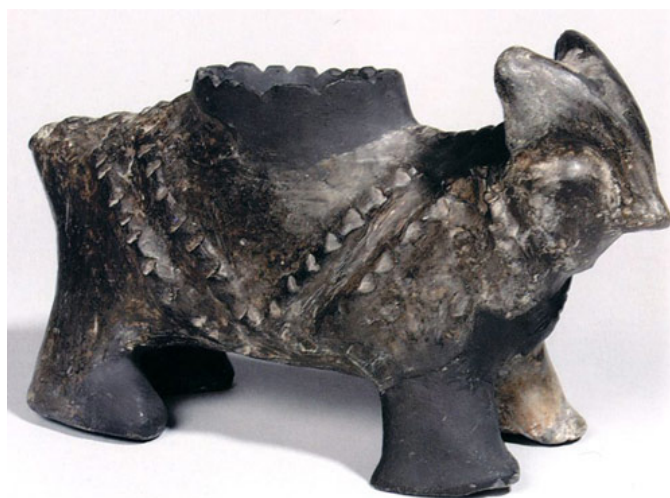
Зооморфна посуда - Винча - Бело Брдо - Народни музеј Београд