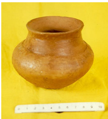
Керамичка посуда - Беловоде (око 7000 г.п.н.е.)

Низ нових керамичких облика рађених руком и доброг квалитета, од сасвим минијатурних димензија до огромних питосапосуда висине један метар, понудиће археолозима одговор на најважније питање – питање функције и намене откривених пећи. Чињеница је да је на овом месту нађено врло мало посуђа (свега десетак кремених ножића) упућује још једном на закључак да није реч о профаном објекту свакодневне намене већ о култном центру једне праисторијске заједнице.