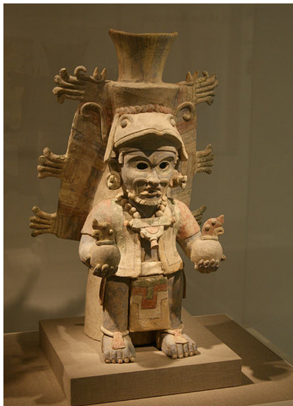
Мајански бог сунца