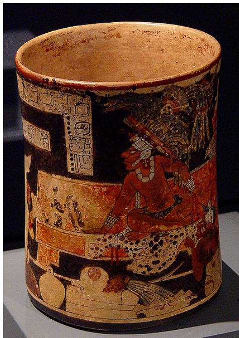
Мајанска јагуар ваза

- Није то фолклор. Они стварно тако живе. Пример су и игре које изводе астечки играчи звани конћероси. Они играју сваке недеље, али су ћутљиви и крију тајну усклађених покрета. Играла сам са њима осам година. Две године сам их само гледала и учила. После су ме сами позвали да играм у центру круга, да водим игру. То је велика одговорност. Морате сасвим да се усредсредите на ритам, музику, песму. Мисли не смеју да вам лутају јер су покрети веома сложени. У прехиспанско време гршке у игри су строго кажњаване. Данас је то доста опуштеније, слободније.