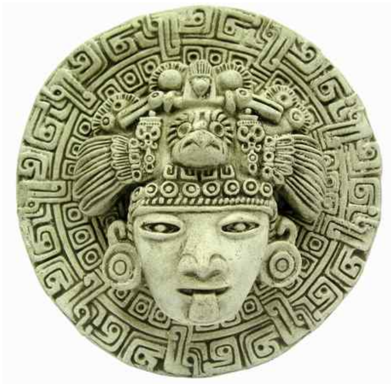
Погребна маска Астека