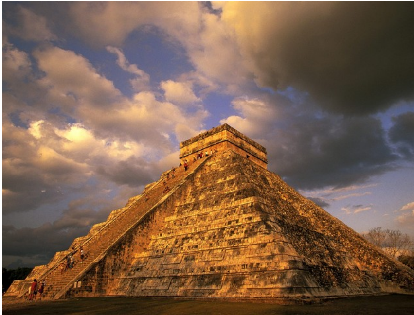
Пирамида Маја у Чичен Ици

- Колико су овакви обреди део стварног живота, а колико су део фолклора и напор да се очува наслеђе?